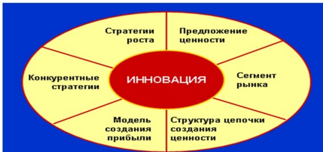
Схема № 2. Ценности Компании

Тем самым, СПК сможет создать мультипликативный эффект при реализации проектов в Атырауской области.