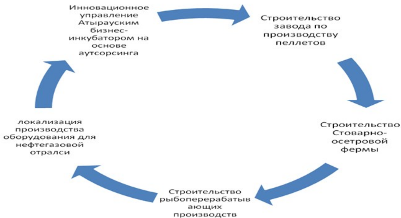
Схема № 5. Приоритетные области в инновационном развитии

К дополнению, на первом этапе (2013-1016), приоритетным в инновационном развитии проектам в областях, представленных в Схеме № 5.