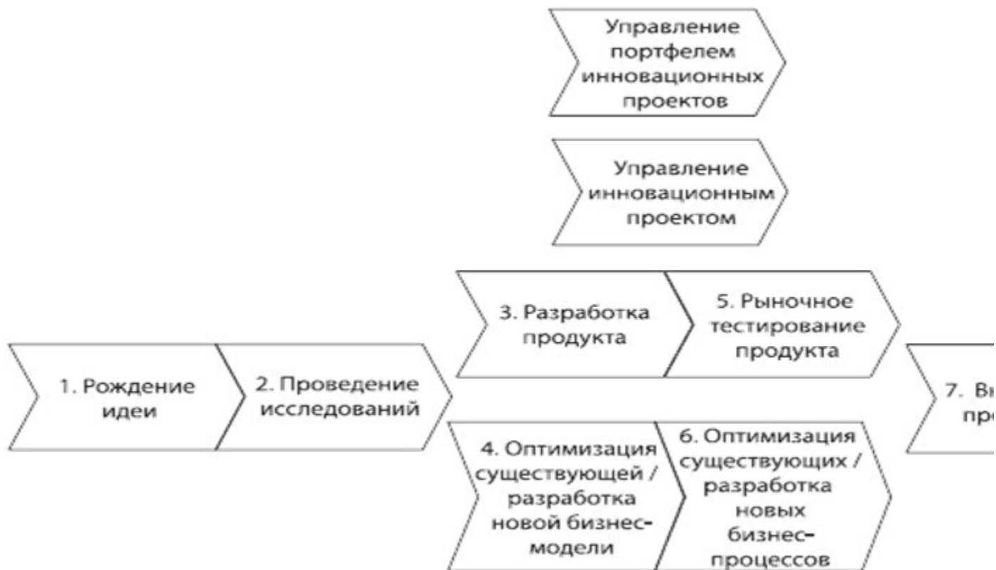
Схема № 3. Модель рассмотрения бизнес-проектов

К дополнению, при рассмотрении потенциальных проектов, сотрудники компании будут придерживаться модели рассмотрения бизнес-проектов, разработанной компанией. Модель представлена